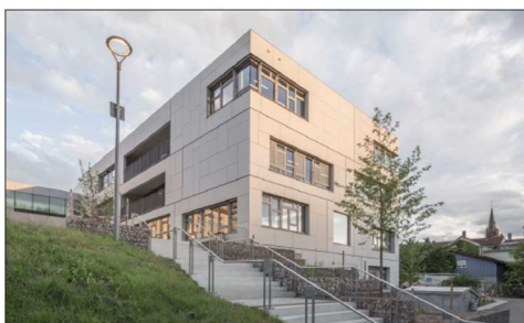
Kostenschätzung Beispiel aus BKI

Bauherr*in: Stadt Schopfheim Hauptstrasse 29-31 79541 Lörrach