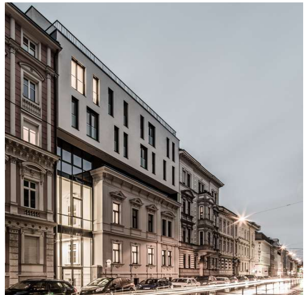
Realisierte Aufstockung – 2 Geschosse Bestand 3+Dach Erweiterung

In einem Beispiel wurde durch Aufstockung Wohnraum geschaffen. Das gesamte Haus wurde wieder rentabel.