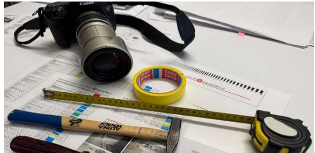
Beispielhafte Unterlagen/ Ausrüstung für eine Prüfung

Benötigen Sie eine Erstprüfung oder ein Angebot für die jährliche Wartung? siehe Erstprüfung und Folgeprüfung .