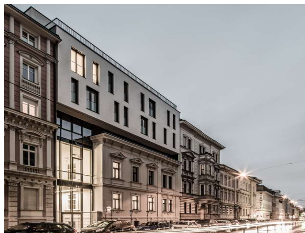
Foto einer Aufstockung

Wollen Sie wissen, welches Potenzial in Ihrem Gebäude steckt? Wo und wann eine Investition lohnt? siehe Potentialanalyse .