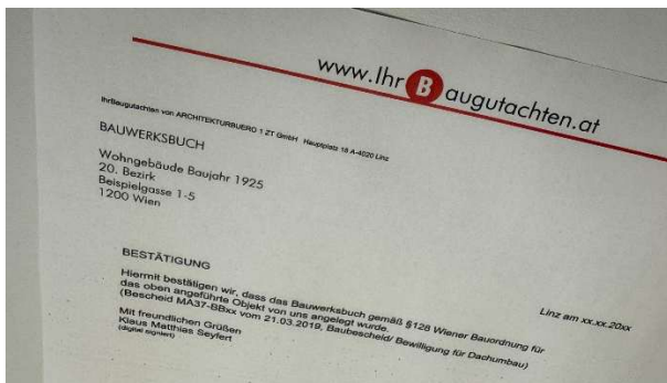
Beispielbauwerksbuch und Bestätigung

Ist ihr Gebäude komplexer, bekommen Sie ein individuelles Angebot.