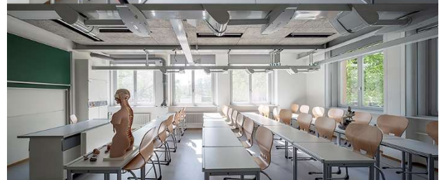
Fertige Fachklasse und Unterrichtsraum