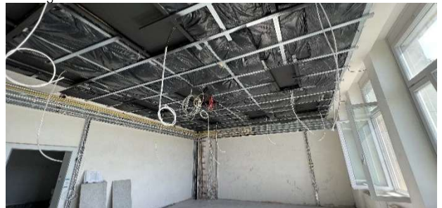
offene Akustikdecke mit ELT Installationen

Die Reparatur der Bestandsdecken und Einbau der freitragenden Decken kostete nur einen Bruchteil gegenüber dem Deckentausch.